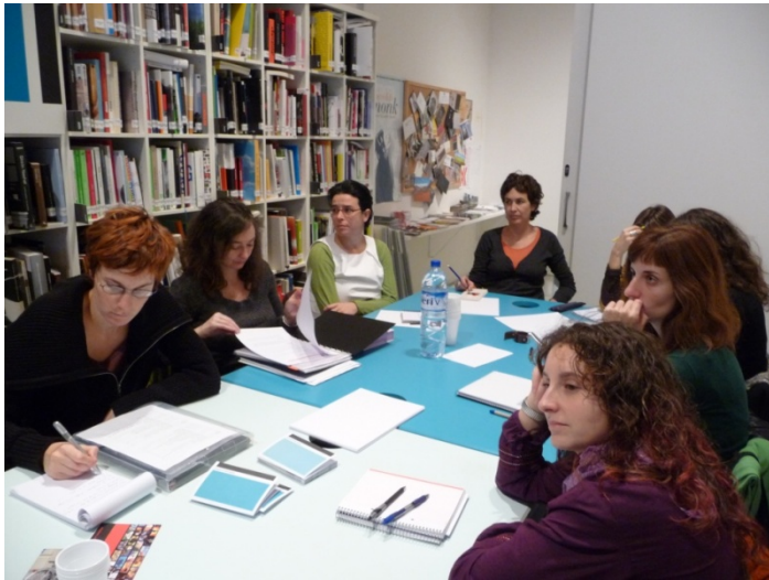
Taula de treball amb l'associació Debajo del Sombrero

Intercanvi al Centre d'art la Panera, Lleida. Dies 10, 11 i 12 de novembre de 2008