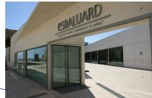
ES Baluard. Museu d'Art Modern i Contemporani. Palma de Mallorca