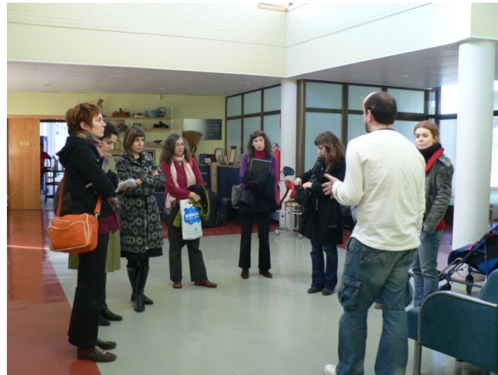
Visita a ASPACE (Associació amb Paràlisis Cerebral d'Osca)