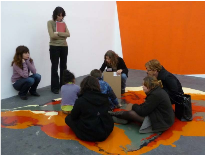
Seguiment de visita a l'exposició Afinitat Electives amb un grup de la classe CLIS (Classe d'integració escolar)

Intercanvi al Centre Régional d'Art Contemporain Languedoc-Roussillon (CRAC LR), Sète. Dies 2, 3 i 4 de març de 2009