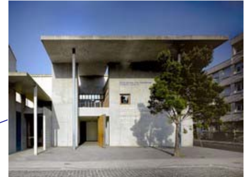
Le CRAC. Sète (Llenguadoc-Rosselló)