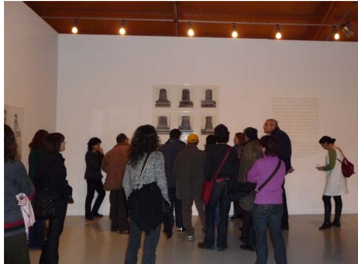
Seguiment de visita En qualsevol lloc, enlloc