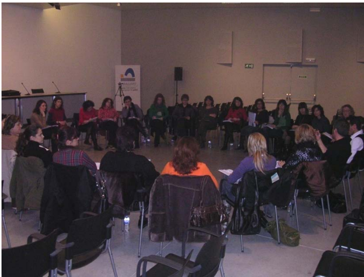
Taula de rodona amb professionals de l'àmbit socio sanitari i de l'educació