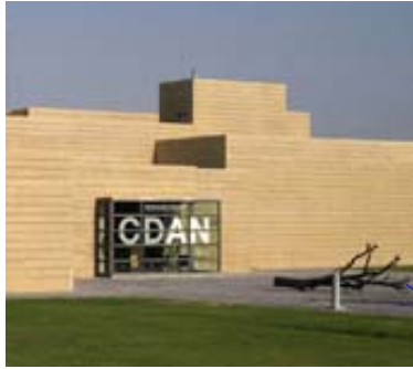
CDAN. Centro de Arte y Naturaleza. Osca