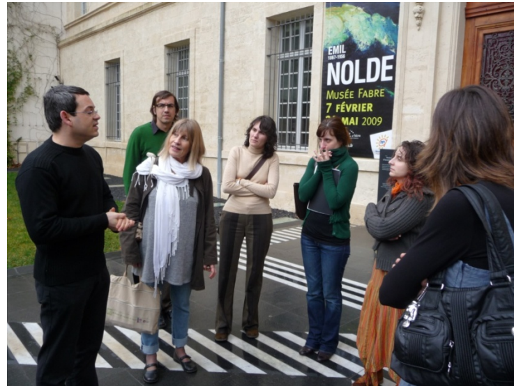
Visita al Musée Fabre a Montpellier amb el responsable d'accessibilitat