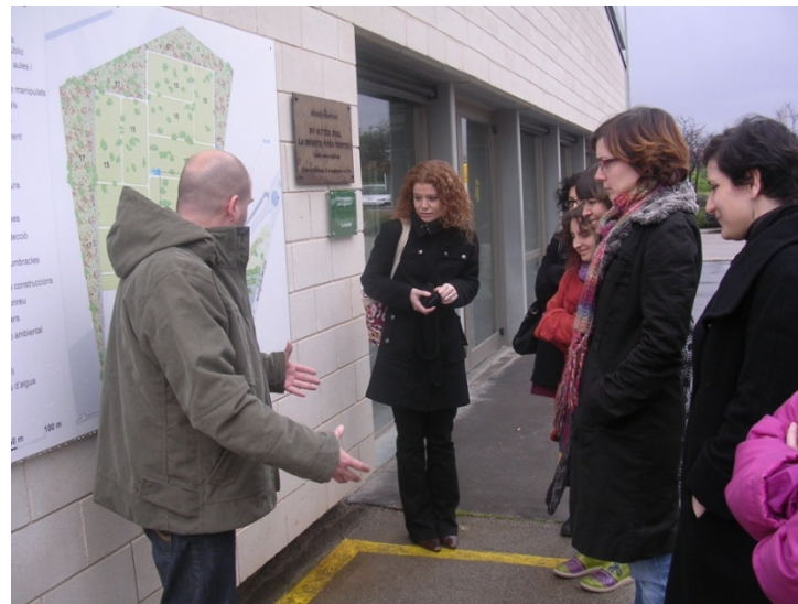
Visita a l'associació Amadip.Esment