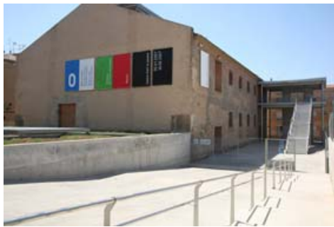
Centre d'Art la Panera. Lleida